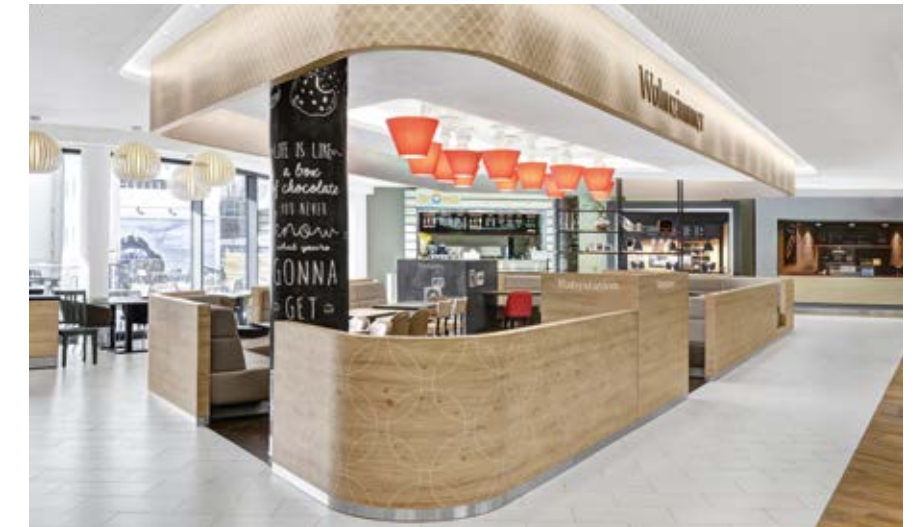
Der Food Court befindet sich auf Ebene 4. Dort gibt es auch ein Sonnendeck.

Doch auch die innere Balance soll im MINTO einen Ort haben. „Fluid Flow“ heißt der Bereich, der mit farnefrohen organischen Formen und der Einladung zu Ruhe und Entspannung aufwartet. Die visuelle Umsetzung dieser Idee fußt auf der Idee der Lavalampe, die mit ihrem unablässigen Kreislauf von Werden und Vergehen nicht nur in Yoga-Studios sehr beliebt ist. Untermalt wird diese beruhigende Atmosphäre vom Geräusch leise brodelnden Magmas. Das junge Publikum der Selfie-Generation findet in der narzisstischen Aufforderung „Frame Yourself“ auch hier einen Ort, der impulsiv bespielt wird und mit sphärischen Sounds sowie einem süßen, keck-verspielten Teenager-Aroma jene Kundenschaft anspricht, die sich – am liebsten in Gesellschaft – noch lustvoll ausprobert.