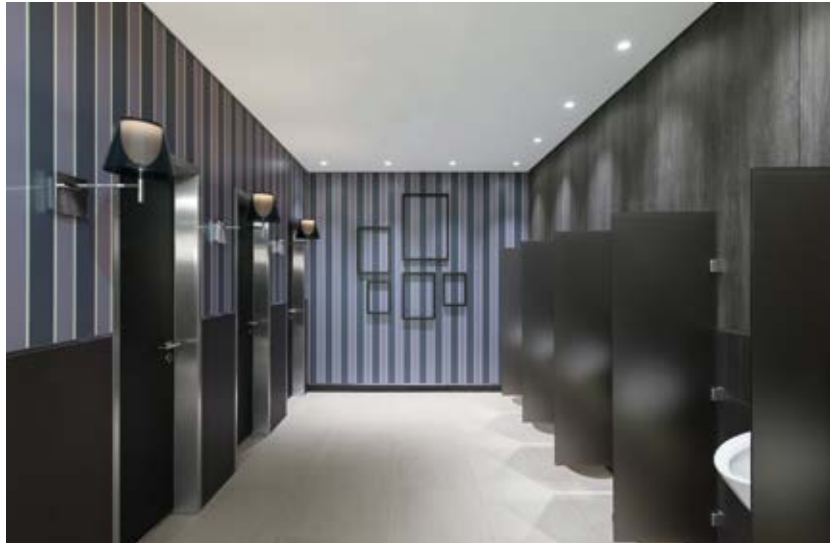
Diskreter Blick in die Herrentoilette: Gute Gestaltung bis ins Detail.