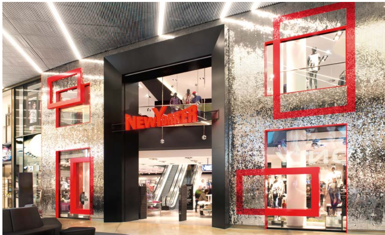
Auf dem Glamour Walk klingt und duftet es nach Lebenslust.

Insgesamt 110 Stores auf vier Etagen, ein Food Court mit elf verschiedenen Lokalen, Ruheinseln und ein Stillraum für junge Mütter – so ließe sich das MINTO auch charakterisieren. Doch es wäre damit nur unzureichend beschrieben. Man braucht schon seine fünf Sinne, um nachvollziehen zu können, dass hier tatsächlich etwas Neues entstanden ist. „Home of 5 Senses“, so will sich die Shopping Mall verstanden wissen. Hier sollen die Kunden auf Schritt und Tritt sehen, fühlen, hören, schmecken und riechen können, um dadurch ihren Aufenthalt im wahrsten Sinne des Wortes als ganzheitliche Sensation zu erleben. Und die beginnt schon mit der Optik: für die Ausstattung der Ebenen mit ihren insgesamt 42.000 Quadratmetern Verkaufsfläche kamen warme, natürliche Farben und Materialien zum Einsatz; die Gestaltung setzte auf die wohltuend beruhigende Anmutung biomorph-organischer Formen, die sich sowohl beim Mobiliar als auch in Dekorations- elementen wiederfinden.