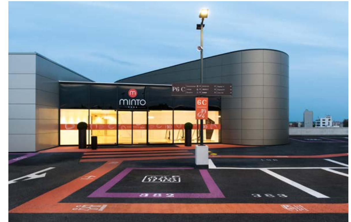
Selbst das Parkdeck des Gebäudes wartet mit einer farbigen Optik auf.