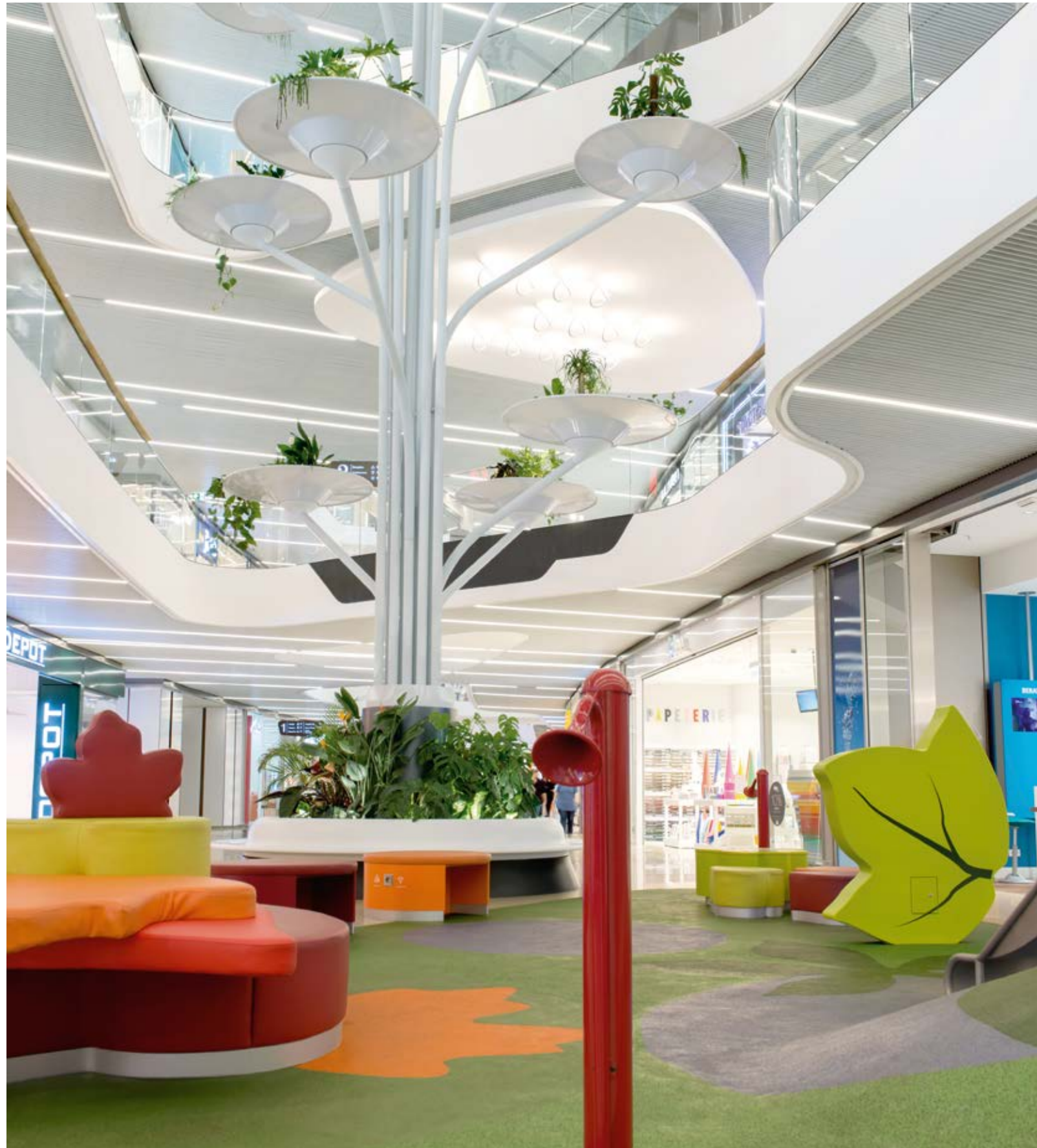
Kinderspielplatz auf dem MINTO Boulevard.